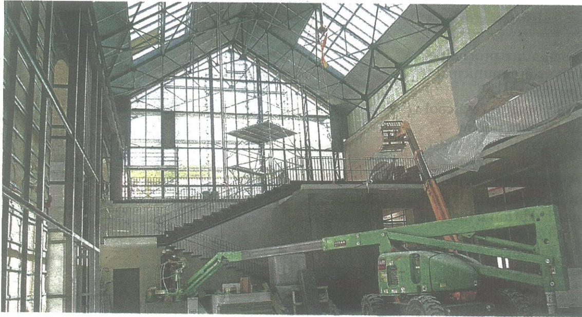
La grande nef, où se tiendra l'accueil de la médiathèque.