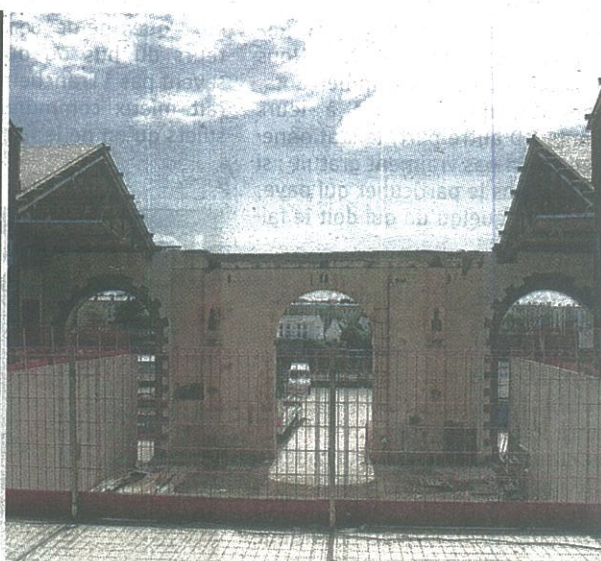
Le coin lecture (à gauche) avec vue sur le pont de Recouvrance et la gare d'arrivée du téléphérique, au pied de la médiathèque.